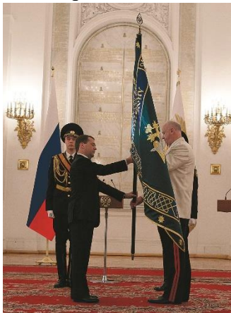
Церемония вручения знамени Следственного комитета Российской Федерации.

глубоких исторических традиций российского следствия, основы которого были заложены еще Петром I, и которые в новых условиях работы будут последовательно развиваться.